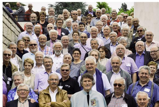
Retrouvailles à l'école des métiers EDF de Soissons-Cuffies

Frédérique Arbouet 16 juin 2016 Actualités Sociales Énergie Ecole de métiers EDF Soissons -Cuffies