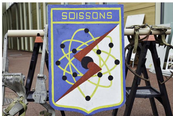
La devise de l'Ecole de métiers de Soissons-Cuffies : « L'avenir est à Toi. L'esprit Soissons sera en Toi. L'école de la vie »

Accédez à l'article présentant « Le Leadership Positif » de Sok-ho Trinh